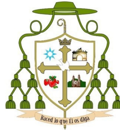
Diócesis de Ciudad Juárez, Chihuahua, México